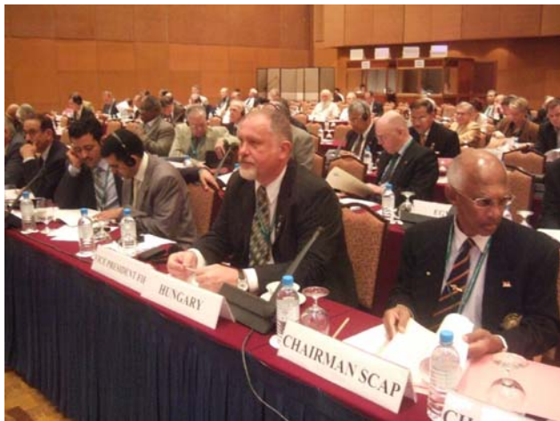
FIR – Vizepräsident Vilmos Hanti auf der Konferenz in Kuala Lumpur

Ich habe die Ehre Ihnen, den Führern und Mitgliedern der Weltveteranenvereinigung, die herzlichsten Grüße und besten Wünsche des Präsidiums und der Mitgliedschaft der Internationalen Föderation der Widerstandskämpfer (FIR) – Bund der Antifaschisten zu übermitteln. Ich möchte Ihnen die besonderen Grüße von Herrn Michel Vanderborght, Präsident der FIR, überbringen. Ich möchte nicht verbergen, dass ich stolz darauf bin, als Vizepräsident der FIR beauftragt worden zu sein, die FIR auf dieser Generalversammlung der berühmten Weltveteranenvereinigung zu repräsentieren.