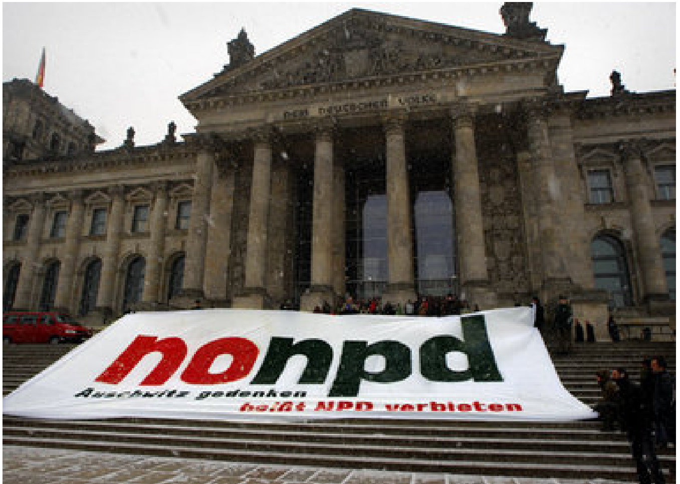
Auf den Stufen vor dem Reichstag in Berlin – antifaschistische Parolen

Die NPD ist zur Zeit in zwei Landtagen und zahlreichen Kommunalparlamenten vertreten. Gemeinsam mit gewaltbereiten Gruppen der Neonazis ist sie verantwortlich für Übergriffe und rassistische Hetze.