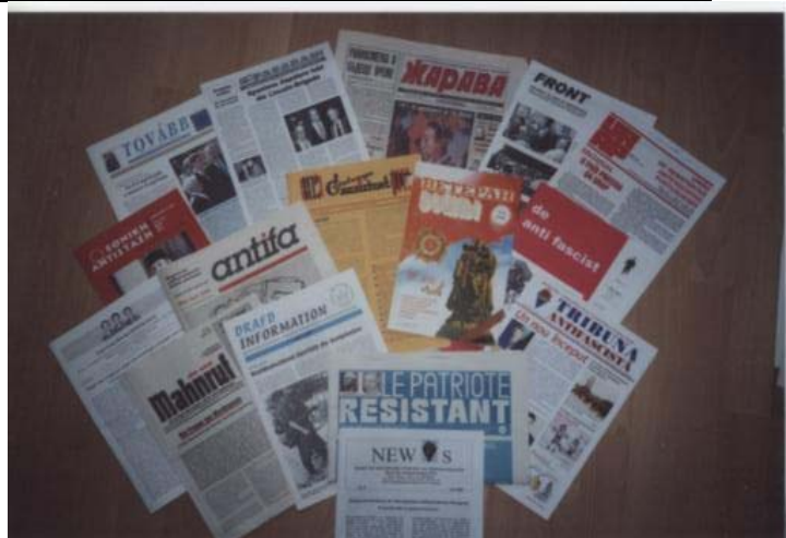
Eine zufällige Zusammenstellung der Zeitungen, die uns in den letzten Wochen erreichten.

Für die politische Wirksamkeit der Arbeit FIR ist es darüber hinaus wichtig, dass die Initiativen der Organisation, unsere Presseerklärungen und andere Verlautbarungen sich in den Zeitungen der Mitgliedsverbände wiederfinden. Damit erleben die Veteranen, die Überlebenden der Konzentrationslager und die Antifaschisten der heutigen Generationen in über zwanzig Ländern Europas und Israels die politische Lebendigkeit unseres internationalen Zusammenschlusses.